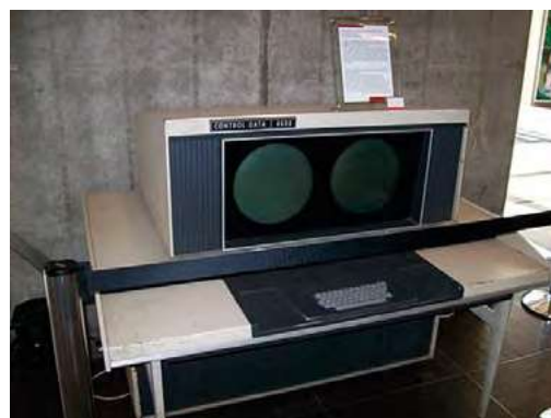
Figura 1. Monitor e teclado de um CDC 6600.

Pode ter um aspeto assustador, mas é muito simples de calcular. Basta ver que aquilo que surge sob o sinal de raiz quadrada é simplesmente \sin^2(t) . Como se está no intervalo [0, \pi/2] , a raiz quadrada disto é \sin(t) , pelo que